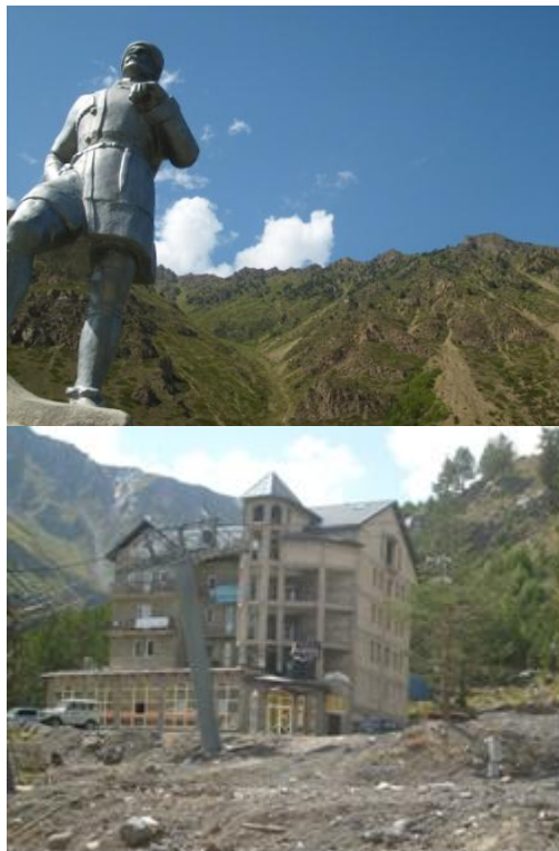
L'albergo dove abbiamo pernottato prima della salita, è la base operativa della Pilgrim Tours, l'agenzia che si è occupata della burocrazia e della logistica non alpinistica in Russia.

Ci avevano sconsigliato di intraprendere questo viaggio per la situazione socio - politica precaria. Il confine con la Georgia è molto vicino, vicine sono anche la Cecenia. L'Ossezia ed altre regioni nelle quali in effetti le cose non sono molto tranquille.