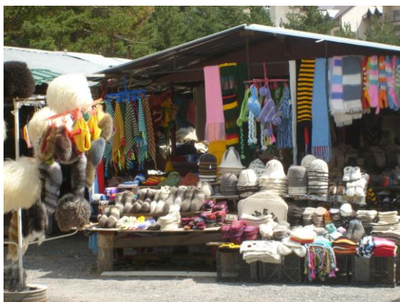
Il mercato di Cheget (vicino Azau) con i tipici prodotti artigianali in lana.

Finalmente siamo in albergo. Si fa per dire visto che entriamo in quello che è un cantiere edile a tutti gli effetti. Per fortuna riusciamo a fare una doccia e a riposare su un letto.