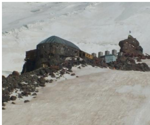
Il rifugio PRIUTT 11 (4000 m)

Il rifugio è piuttosto spartano: niente gabinetti ad eccezione di un paio di gabbiotti in legno esposti alle intemperie. Niente acqua (occorreva sciogliere la neve) niente corrente elettrica (ad eccezione di un gruppo elettrogeno funzionante dalle 19.00 alle 20.00).